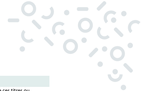
Tableau des grades à recenser