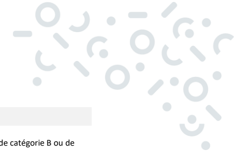
Tableau des grades à recenser