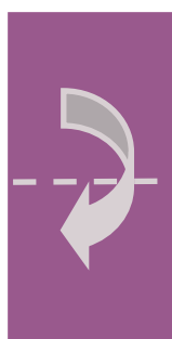
2 ème pliage