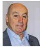
Jean-Marie SAILLARD PRÉSIDENT DE LA COMMUNAUTÉ DE COMMUNES DES LACS ET MONTAGNES DU HAUT-DOUBS