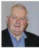
François CUCHEROUSSET PRÉSIDENT DE LA COMMUNAUTÉ DE COMMUNES DES PORTES DU HAUT-DOUBS