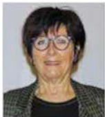
Dominique MOLLIER Membre du bureau MAIRE DE VILLERS LE LAC